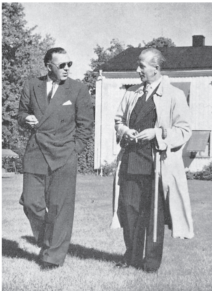
Åke Wiberg hade från slutet av av 1940-talet återkommande kontakter med kungahuset. Här syns han tillsammans med prins Bertil på Apertin.